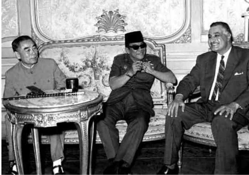
لقاء عبد الناصر مع سوكارنو رئيس إنديسيا وشواين لاي رئيس وزراء الصين في القاهرة